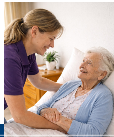
Bild generiert mit KI-Software (ChatGPT)